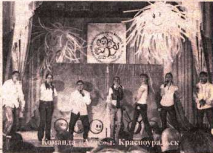
Команда «Атас» г. Красноуральск

Красноуральскую команду «Атас» отметили дипломом за участие. Ребята действительно МОЛОДЦЫ! У них всё еще впереди.