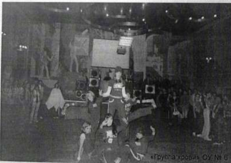
«Группа крови» ОУ № 6

Здорово, что существует этот фестиваль в нем ребята сплачиваются, учатся понимать и поддерживать друг друга. Ведь не важно, кто победил, главное, участники сумели показать себя, блеснуть своей оригинальностью и индивидуальностью. Бесспорно, молодцы все! Слова благодарности все команды выражают Комитету по делам молодежи и Дворцу культуры «Химик», при поддержке которых прошел фестиваль «Тинейджер-Лидер».