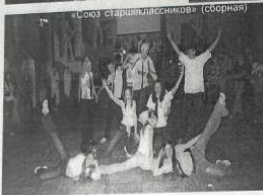
«Союз старшеклассников» (сборная)