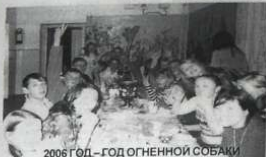
2006 ГОД — ГОД ОГНЕННОЙ СОБАКИ