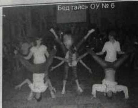
Бед гайс» ОУ № 6