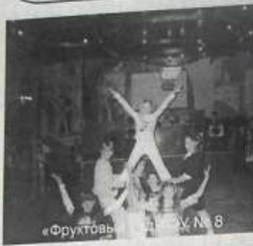
«Фруктовы» ОУ № 8