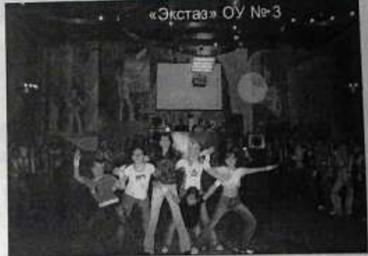
«Экстаз» ОУ № 3