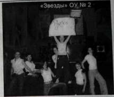
«Звезды» ОУ № 2